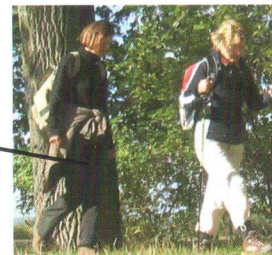
Bad Nenndorf 10.08.2019