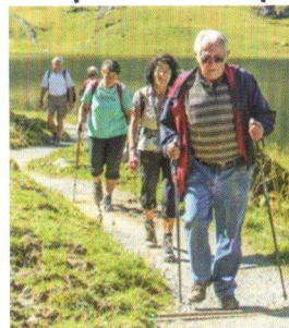
Bad Harzburg 22.06.2019