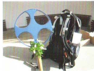
Raum Südharz 25.05.2019

bin bei Dir , bis an dein Lebensende. Ver- trau auf mich.“